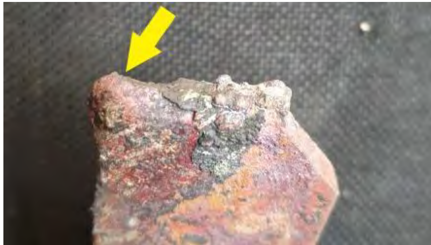
Imaginea nr.4 - topitura de cupru provocată de arc electric, la capătul barei de legătură

Constructiv între capătul barei și capătul spirei exista o conexiune realizată prin sudare (lipire) cu aliaj din cupru-argint. Comisia de investigare consideră că cel mai probabil, supunerea materialului sudurii timp de 51 de ani la vibrații puternice în contextul unor variații mari de temperatură (condiții specifice utilizării în domeniul tracțiunii electrice), a dus la producerea fenomenului de oboseală a materialului din sudură, fapt care a condus la apariția unor fisuri în materialul din care era alcătuită sudura. În aceste condiții, fisurile din materialul de sudură, fiind intercalate pe circuitele electrice de forță ale locomotivei, au condus la generarea unor arcuri electrice care au topit capătul barelor de cupru.