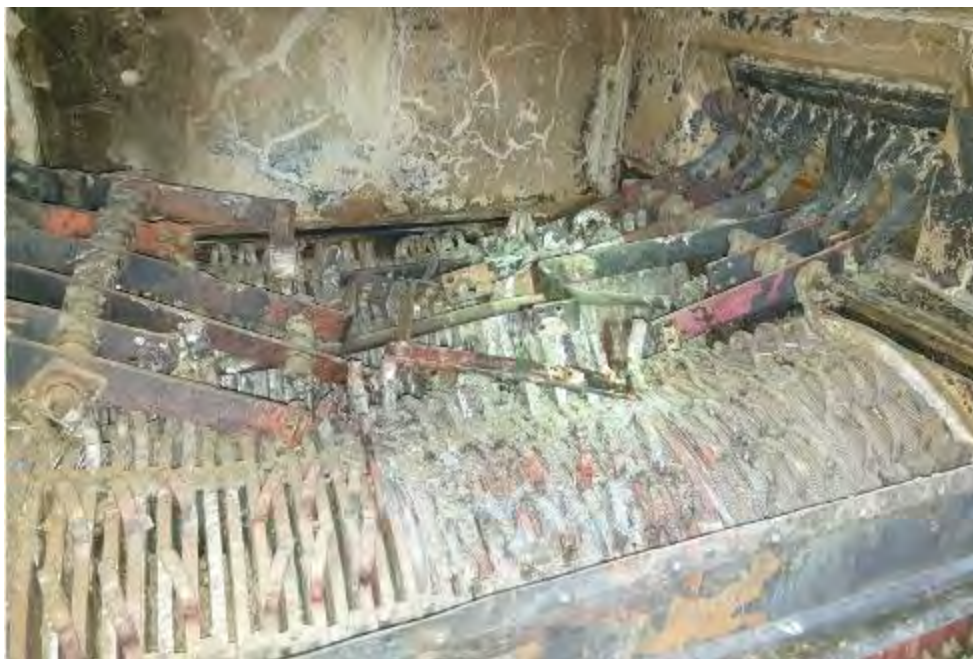
Imaginea nr.5 - selful de aplatizare afectat termic

Având în vedere că aparatura de bord de la locomotiva EA 071 a fost distrusă în totalitate de incendiul produs, comisia de investigare a analizat și interpretat datele înregistrate de instalațiile IVMS (instalație de măsurare a vitezei și de siguranță) și CEL (contor consum energie pe locomotivă) de pe locomotiva EA 485 (împingătoare).