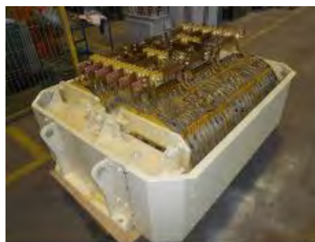
Imaginea nr.3 – model de self de aplatizare în stare nouă

Blocul selfului de aplatizare este montat sub răcitorul de ulei a grupului transformator principal, fiind răcit de același ventilator