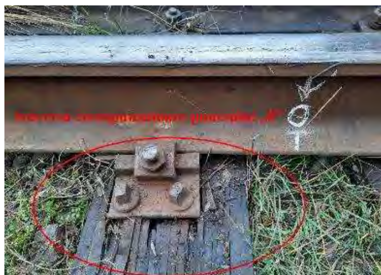
Foto nr.6: Traversa T 0 -traversa situată în imediata apropiere a punctului „0”