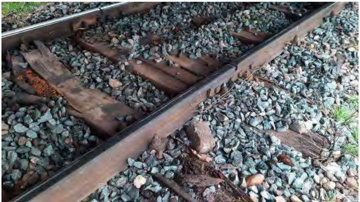
Foto nr.4: urmă de rulare a buzei bandajului pe suprafața de rulare a șinei din dreapta

Din punctul „0” s-au efectuat, în sens invers sensului de mers al trenului, măsurători la ecartament și nivel în dreptul unui număr de 74 picheți din 0,5 m în 0,5 m. De asemenea, din același punctul „0” s-au efectuat, în sensul de mers al trenului, măsurători la ecartament și nivel în dreptul unui număr de 100 traverse. Măsurătorile s-au efectuat în regim static, cu tiparul districtului L3 Barboși Triaj (verificat metrologic).