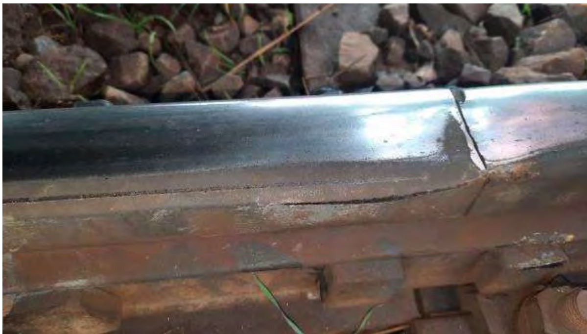
Foto nr.2: prima urmă de deraiere la km 2+921 - punctul „0” (șina din partea stânga)

În cazul celei de a doua osii a boghiului deraiat s-au constatat urme de lovire de către buza roții din dreapta pe tirfoane la o distanță de 51 m față de punctul „0” și urme specifice de frecare pe suprafața activă a șinei cu aproximativ 9 m înainte de căderea în exteriorul căii. De asemenea, în prisma de balast s-au constatat urmă produse de roata din stânga a aceleiași osii pe o distanță de 1,2 m până la oprirea trenului.