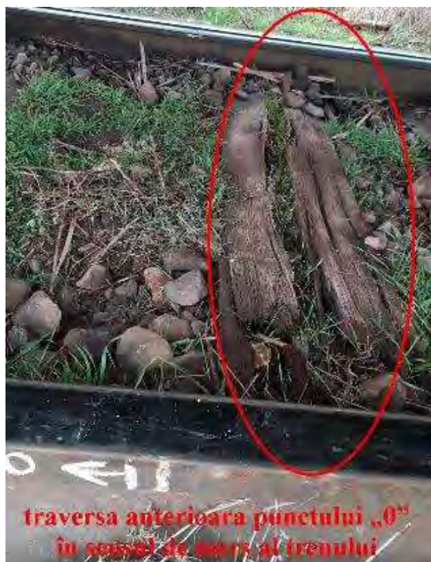
Foto nr.5: Traversa T -1 -prima traversa aflată înainte de punctul „0”

Din cele de mai sus, precum și din fotografiile efectuate imediat după producerea accidentului (foto nr.5 și 6), se constată faptul că, în zona de producere a deraierii, existau în cale 8 traverse de lemn normale necorespunzătoare consecutive (de la T -1 - prima traversa aflată înainte de punctul „0” și până la T 6 ), a căror stare tehnică nu mai putea asigura prinderea eficace a plăcilor metalice de traverse.