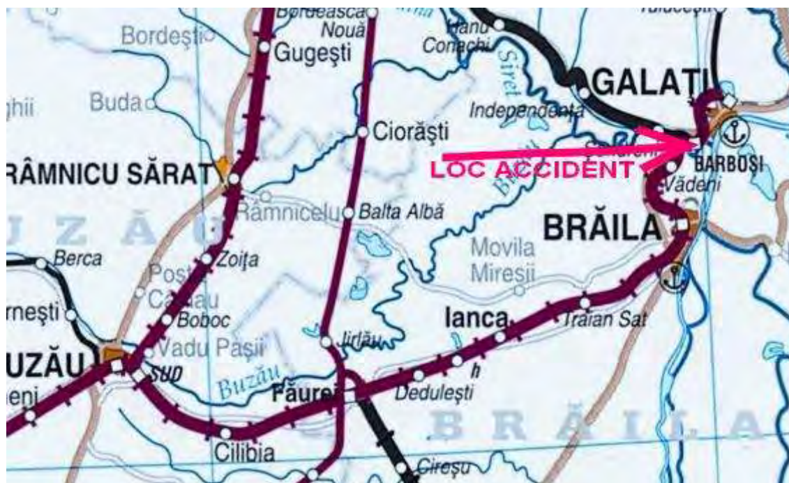
Figura nr.1 - locul producerii accidentului feroviar

La data de 06.12.2021 , ora 08:20 , în stația CFR Barboși Triaj , pe zona cuprinsă între schimbătorii de cale nr.28 și 118, la km 2+921 s-a produs deraierea primului vagon din componerea trenului (nr.33535421218-5) de primul boghiu în sensul de mers.