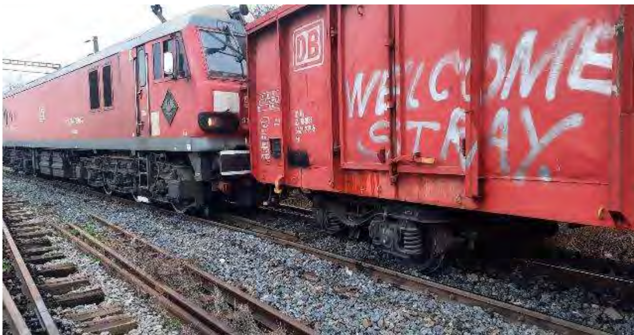
Foto nr.1: vagonul nr.33535421218-5. în stare deraiată